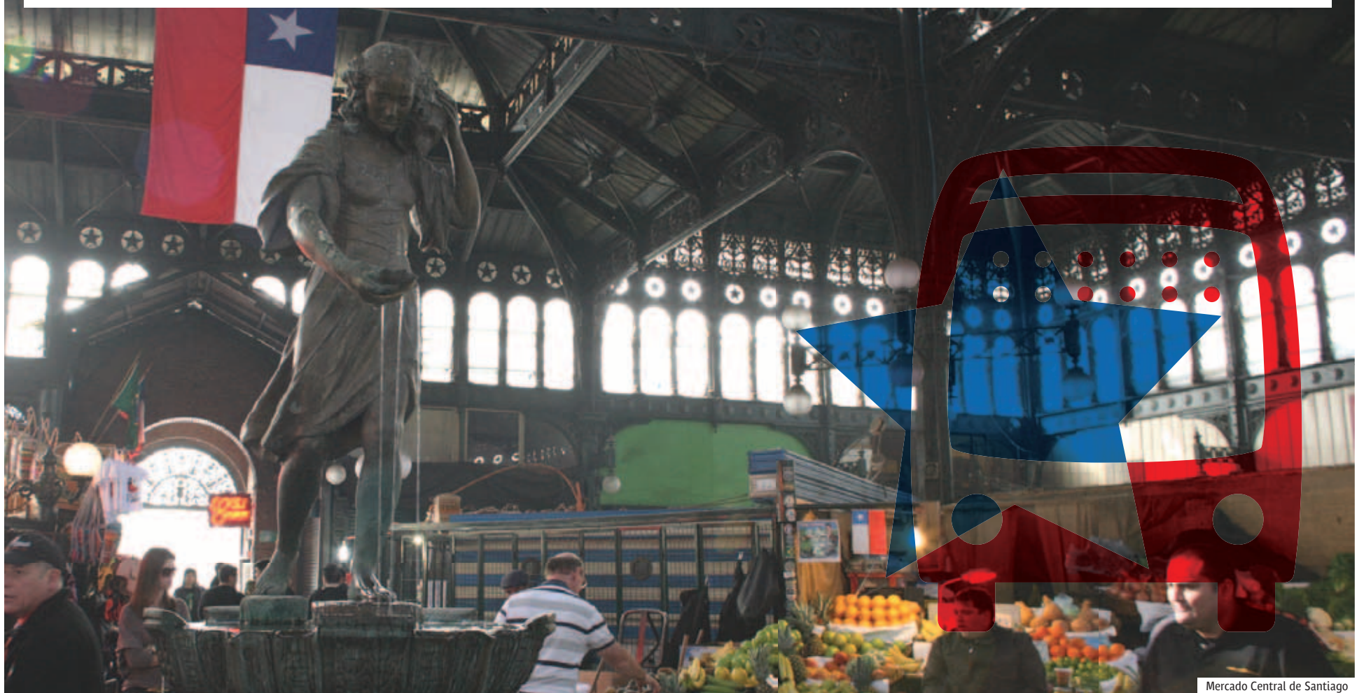
Mercado Central de Santiago