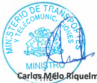
Carlos Melo Riquelme

Ministro de Transportes y Telecomunicaciones (S)