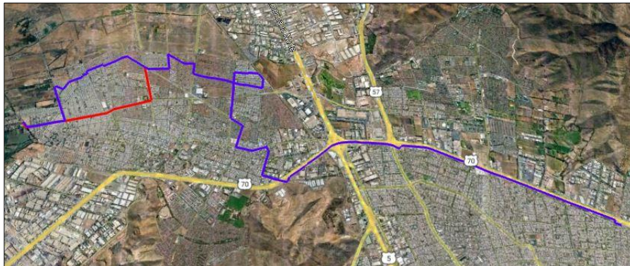
Figura 8. Detalle del tramo modificado Servicio 1343 Retorno.