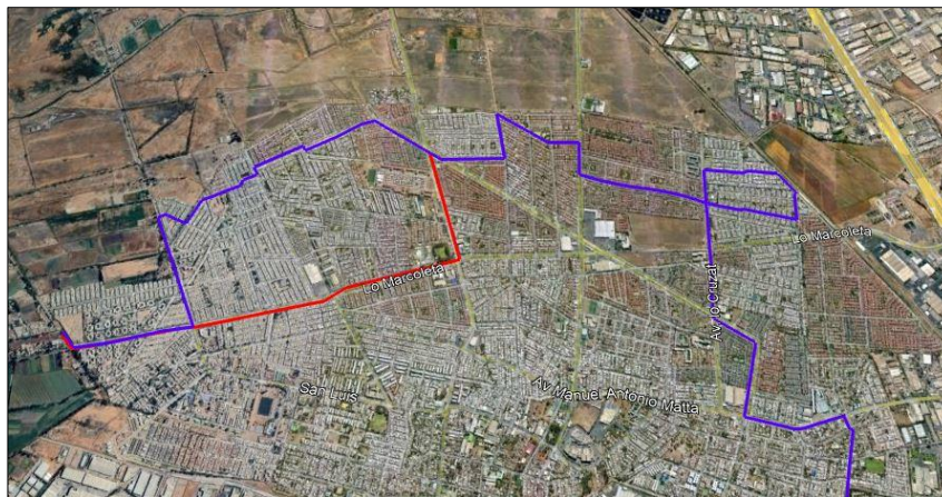
Figura 9. Vista general del trazado actual y modificado servicio "Nuevo" Ida.