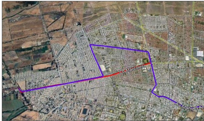
Figura 5. Vista general del trazado actual y modificado servicio 1343 Ida.