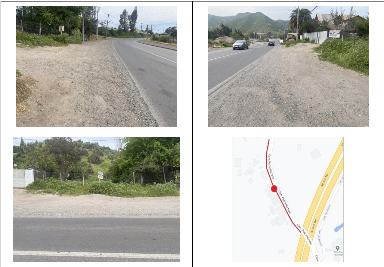
Figura 2. Esquema de fotografías del catastro de nuevos puntos de parada ID 1