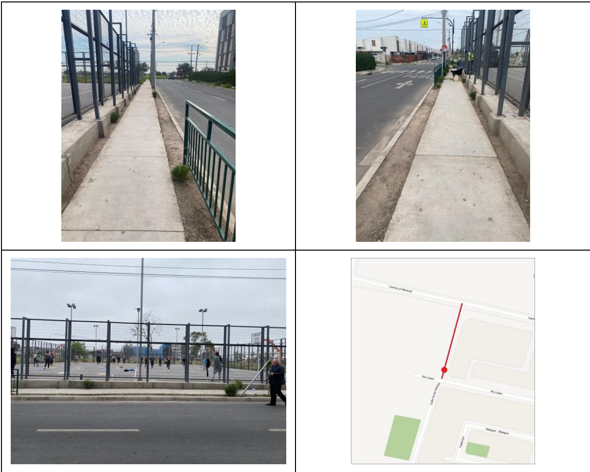
Figura 2. Esquema de fotografías del catastro de nuevos puntos de paradas