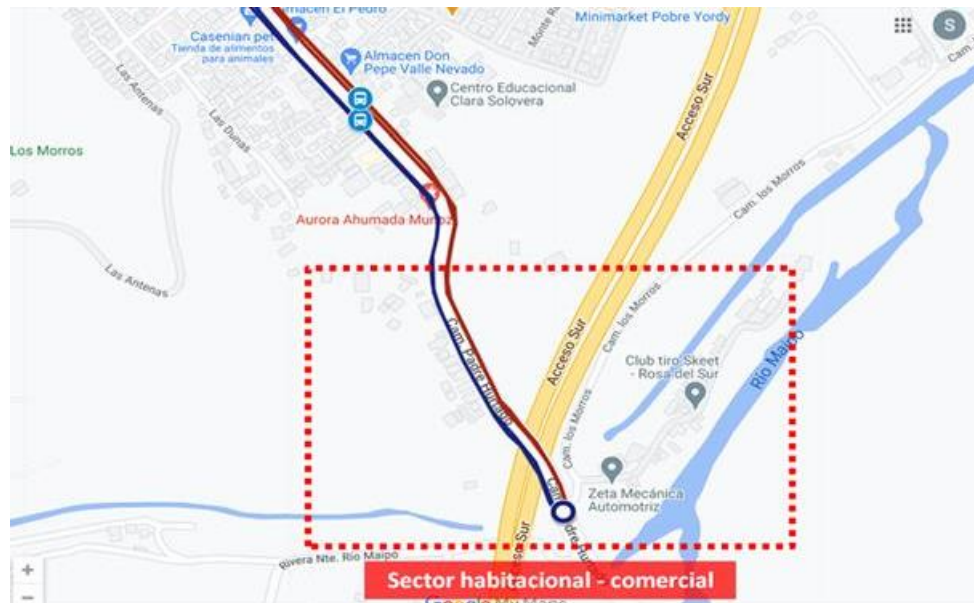
Figura 1. Vista de zona a considerar nuevos paraderos.

Se propone la creación de dos nuevas paradas, en sentido Ida y Regreso, en Camino Padre Hurtado, esquina Acceso Sur.