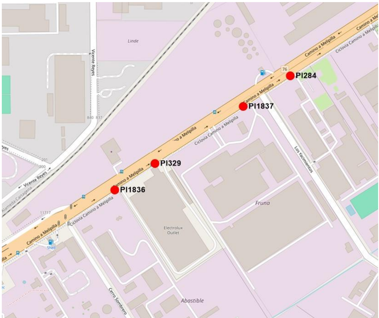
Figura 2: Reasignación de paradas PI329, PI284 a PI1836 y PI1837 en los servicios 115 y 115c.