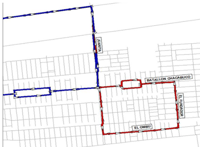
Figura 1-1 Vista de modificación de ruta, servicio G23.